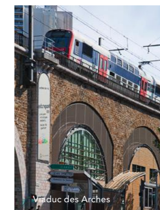
Viaduc des Arches