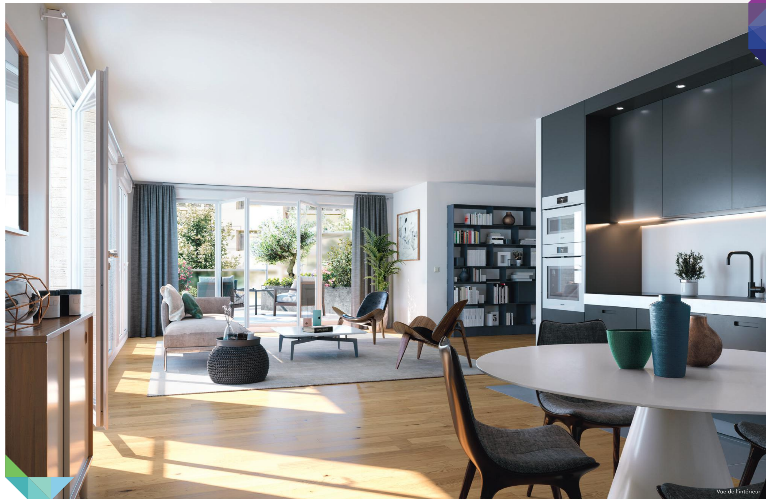
Vue de l'intérieur

ou jardin. Côté jardin, du 4 e au 6 e étage, les paliers desservent un seul appartement, gage réel d'intimité pour son propriétaire, puis 2 logements du rez-de-chaussée au 3 e étage. En toute indépendance, un deux pièces et un quatre pièces sont à vivre comme des maisons, puisqu'ils bénéficient de leur accès et jardin privatifs au rez-de-chaussée.