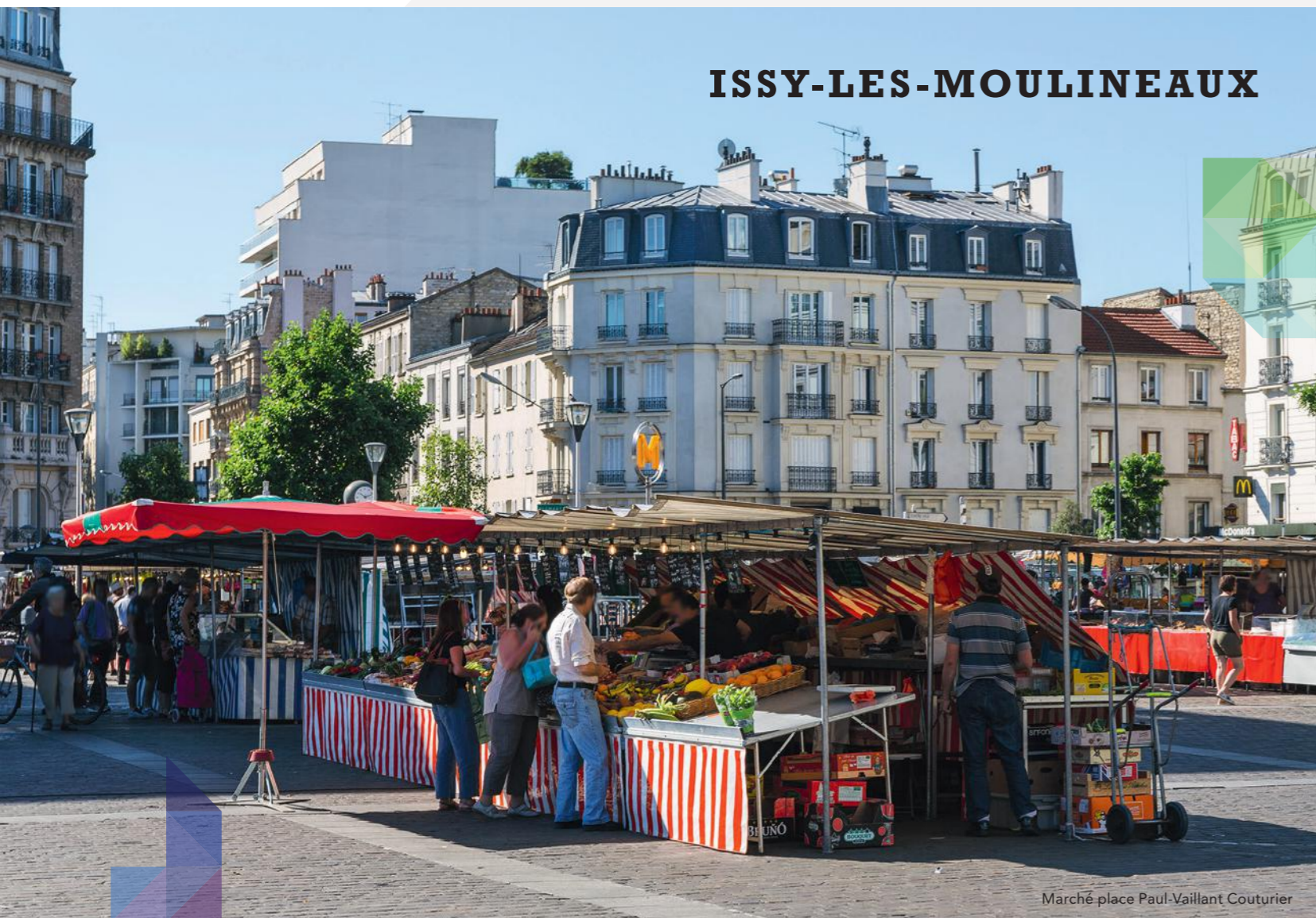
Marché place Paul-Vaillant Couturier