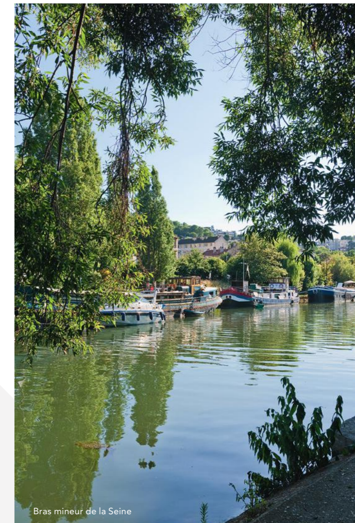
Bras mineur de la Seine

Essentiel bénéficie de tous les avantages d'un quartier à parcourir à pied. Les équipements culturels et sportifs – le parc omnisports Suzanne Lenglen et l'Aquaboulevard à 500 m*, la médiathèque et le conservatoire à moins de 10 minutes à pied – offrent déjà de nombreuses activités de loisirs. Le dynamisme de la ville, la richesse de sa vie associative, le nombre et la qualité de ses équipements, l'ambition environnementale et le développement des hautes technologies en font un cadre de vie idéal pour les familles.