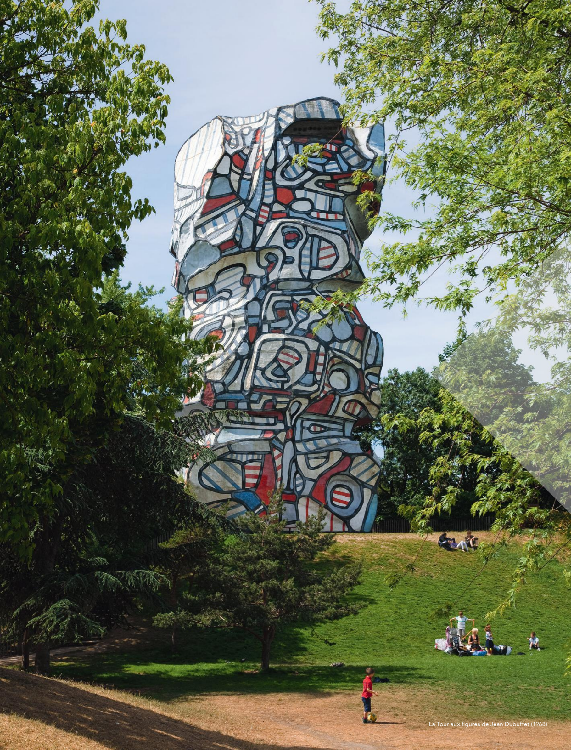
La Tour aux figures de Jean Dubuffet (1968)