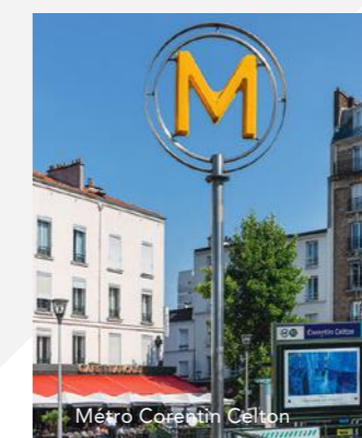
Métro Corentin Celton