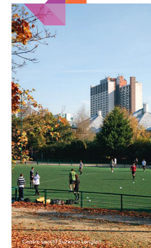
Centre sportif Suzanne Lenglen