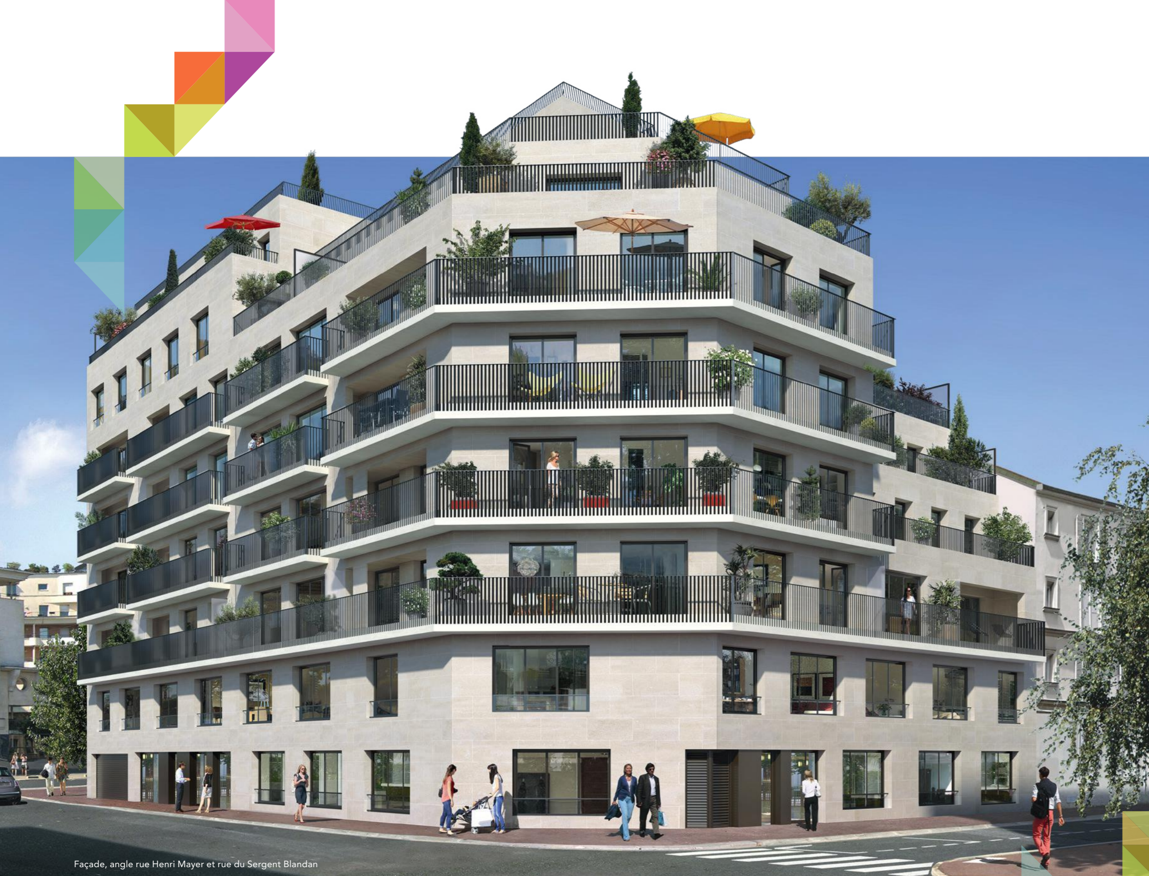
Façade, angle rue Henri Mayer et rue du Sergent Blandan