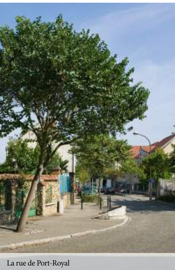
La rue de Port-Royal

La ville à la campagne, tel est le slogan de la commune !