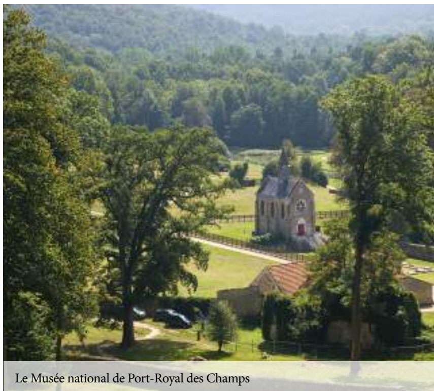
Le Musée national de Port-Royal des Champs