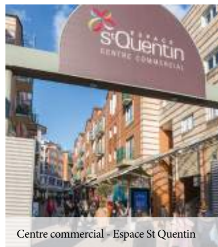
Centre commercial - Espace St Quentin

Le calme du parc régional de la Vallée de Chevreuse, propice à de belles balades, le dynamisme et les équipements de Saint-Quentin-en-Yvelines, comme la médiathèque Saint-Exupéry, le théâtre de Saint-Quentin et