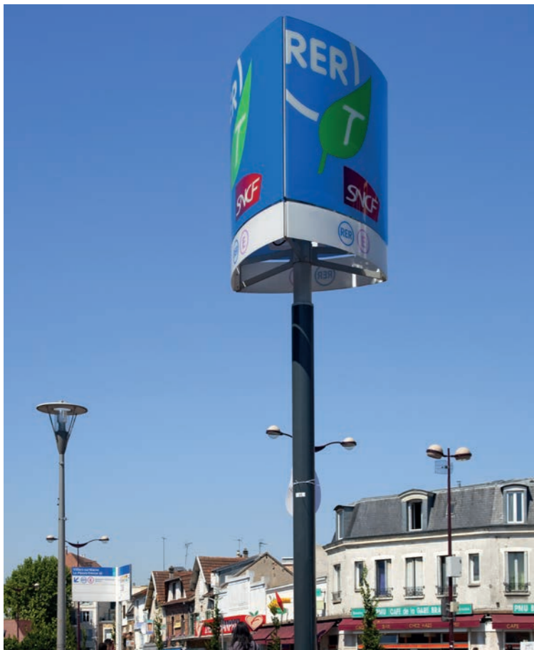
Gare RER E Villiers-sur-Marne - Le Plessis-Trévisé