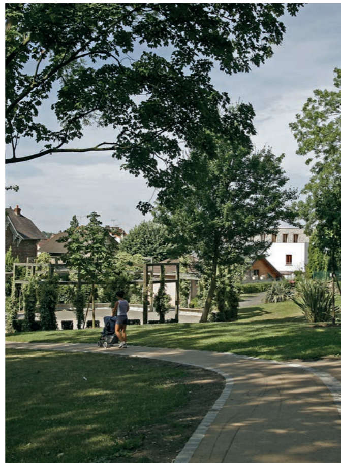
Parc du Bois Saint-Denis